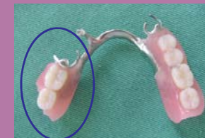
欠けたところあり