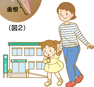
すぐに歯医者さんへ行く